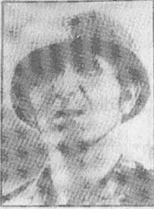
الجنرال محمد أوفير المتهم